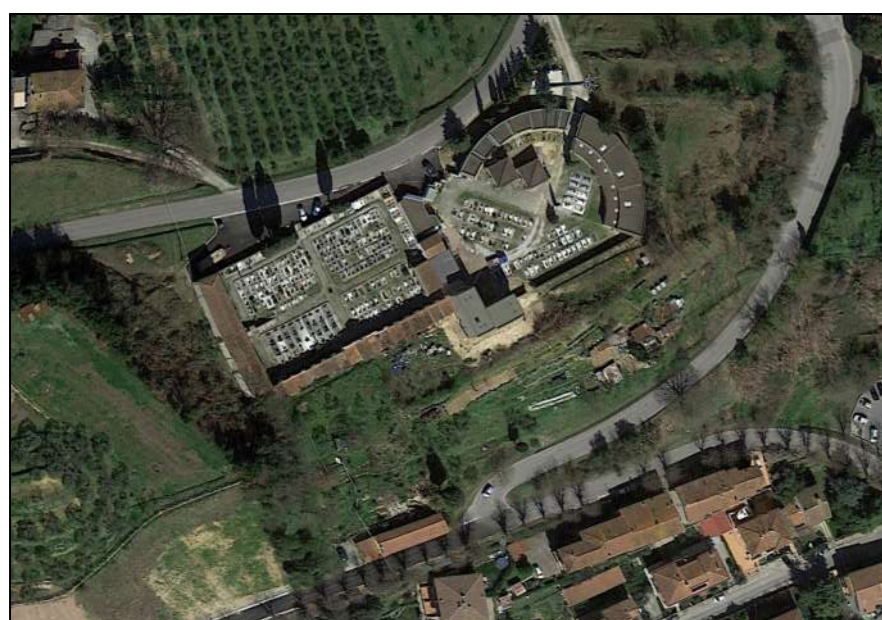
TAVOLA n° A09